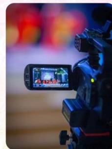
Фото и видеосъемка - в подарок за отзыв

Фирменная коллекционная наградная продукция